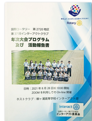
インターアクト年次大会 表紙

繰り返しになりますが、皆様、大会開催にご尽力、ご参加頂き、誠にありがとうございました。